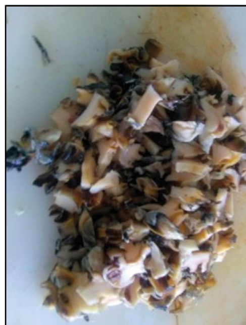
Figura 1. Carne de caracol para la elaboración de escabeche de P. flagellata .

Los caracoles fueron lavados con abundante agua de la llave, sacrificados por shock térmico, colocándolos en agua a 80 °C durante 15 min. Los caracoles fueron desconchados, eviscerados, lavados y puestos a cocción a 100 °C durante 120 min para el ablandamiento de la carne (figura 1). Los caracoles, junto con la cebolla, pimienta entera y los ajos, se dejaron a fuego medio en 350 ml de vinagre por 5 min. Se agregaron los nopales, la zanahoria, los chiles y los demás aditivos previamente limpiados y cortados, más 150 ml de aceite de oliva. La mezcla fue puesta a cocción por 15 min a fuego medio. Finalmente, se colocaron hojas de laurel a la mezcla con los caracoles previamente cocinados. El producto final (figura 3), se dejó reposando en condiciones de refrigeración.