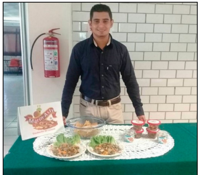
Figura 3. Producto final (escabeche de Pomacea flagellata ).

De acuerdo con los resultados obtenidos, es posible observar que el contenido de proteína del escabeche de P. flagellata ( 11.25 \pm 2.6\% ), es mayor a los escabeches convencionales, cuyo contenido proteico oscila entre 1 y 2%. Sin embargo, en un estudio para determinar las propiedades físicas, químicas y microbiológicas del caracol en salmuera enlatado Pomacea maculata , López-Vázquez (2001) reveló un contenido proteínico de 22.07%. Aunque los niveles de proteína entre una y otra